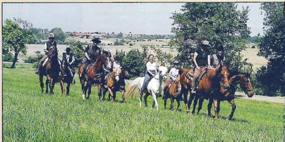
Natur pur - wer bei Saarland nur an rauchende Schloten denkt, der irrt: Der größte Teil des kleinen Bundeslandes im Westen ist ländlich strukturiert.

Spanien, Italien oder gar die Karibik? Meistens bekam man ein Kopfschütteln zur Antwort, wenn man in den vergangenen Wochen nach Ferienzielen 2003 fragte. „Nicht-Verreisen“ - ein Trend? Aber jetzt sind sie da, die großen Ferien, und die Entdeckerlust erwacht: Vielleicht könnte man ja doch für einige Tage noch kurzfristig, quasi last minute, etwas unternehmen? Wir stellen auf dieser und den folgenden Seiten einige Ideen für originelle Kurztrips rund um's Pferd vor, von den Karl May-Festspielen bis zum Ludwig-Musical. Das Beste: Man kann jede Menge Karten gewinnen! Und als absolute Premiere können Sie die vorgestellte „Saarland im Sattel“-Tour mit uns reiten - der erste UNSER PFERD/ REITER PRISMA-Erlebnisritt startet am 24. September 2003!